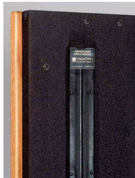
Rückseitig wird das extrem lange, im Pegel anpassbare Hochtombändchen sichtbar

PLATTENSPIELER: Transrotor Rondino Nero/TR 5000/Benz LP-S, Rega RP10/Benz SLR SACD-SPIELER: Accuphase DP-550 VOR-/ENDST.: Accustic Arts TUBE-PREAMPLII-MK2/AMPLII-MK2 VOLLVERSTÄRKER: Audionet SAM G2, T+A PA3000HV, Symphonic Line RG9 MKIV Ref. LAUTSPRECHER: DALI Epicon 6, Dynaudio Contour S5.4, Verity Audio Leonore LS-KABEL: HMS Gran Finale Jubilee, In-Akustik LS-1603, Purist Audio Design Alzirr