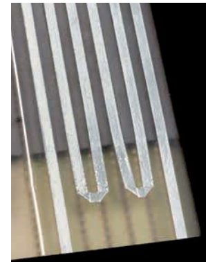
So wie oben sieht das Prinzip in der Praxis aus. Wie der Heizfaden auf der Autoheckscheibe kringelt sich der schmale Aluleiter über die Folie

vom Aussehen her entweder zu Ihrem Stil oder eben nicht. Ich mag sie, sehr sogar! Habe ja selbst den größten Teil meiner HiFi-Zeit mit einem Flächenstrahler verbracht: Martin Logans legendäre CLS war ebenfalls flach und breit – und hoch, wenn auch längst nicht in der Dimension der übermannsgroßen 20.7.